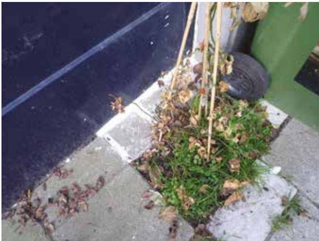
13. De open grond wordt gedeeltelijk bedekt met stoeptegels, en de kieren worden afgedicht met mortel.