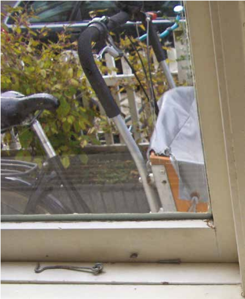
7. Linker raam (niet afgekit).