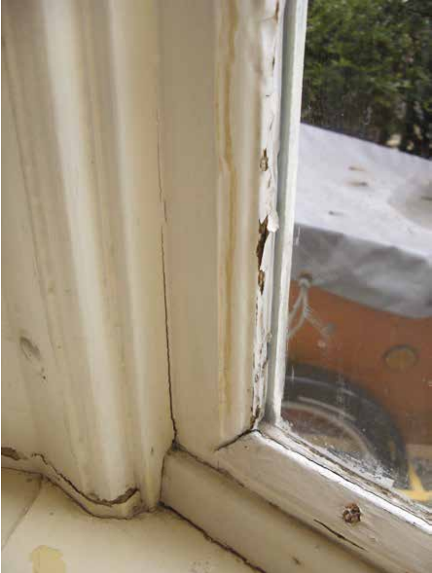
6. Rechter raam (afgekit).