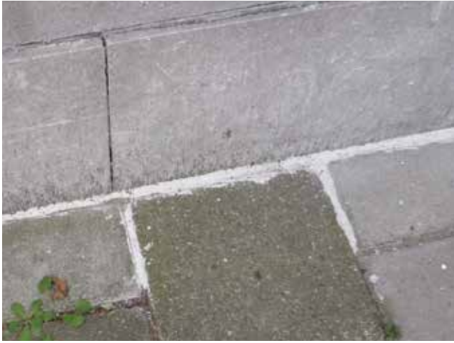
12. Een voorbeeld van de afdichting van de kier tussen de stoeptegels en de gevel, en tussen de stoeptegels.